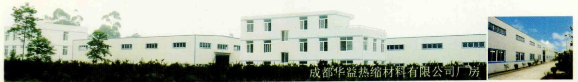
成都华益热缩材料有限公司厂房

我公司是广大用户的真诚朋友,信誉卓著,服务周到,供货及时,价格合理,实行三包,在正常操作和使用情况下,产品在二十年内如有质量问题包换,是世界上唯一对该产品提供二十年质量保证的生产厂家。